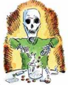
NE MÉLANGE PAS LA COCAÏNE AVEC D'AUTRES DROGUES (Y COMPRIS L'ALCOOL ET DES MÉDICAMENTS SUR ORDONNANCE).