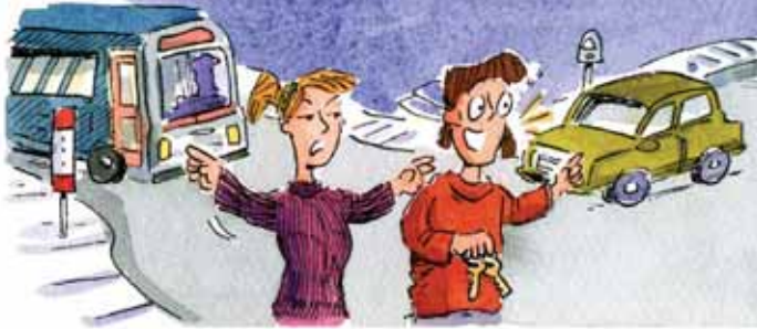
NE MONTE PAS DANS UNE VOITURE DONT LE CONDUCTEUR EST EN ÉTAT D'EUPHORIE.