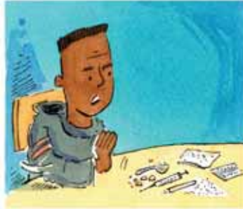
CHOISIS DE DIRE NON À LA COCAÏNE !