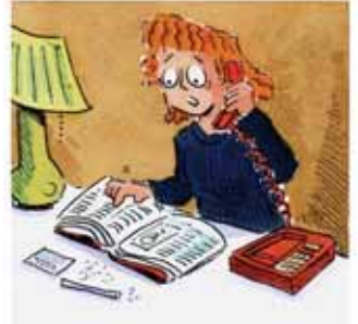
ESSAIE DE L'ABANDONNER !