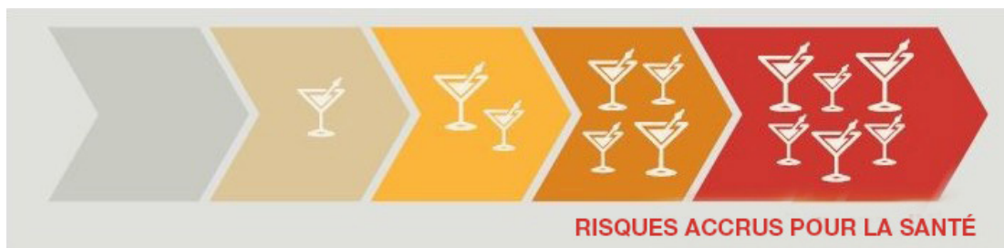
Figure 2 Effets sur la santé liés à la dose d'alcool consommée